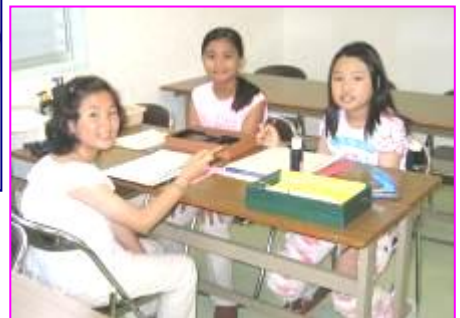
【学生ボランティアさん